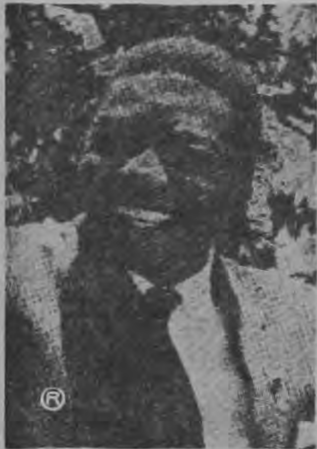
TSHOMBE ...anunció el cese de su lucha separatista...

LEOPOLDVILLE, 15. AP.— El Presidente de Katanga Moïse Tshombe abandonó hoy su lucha separatista. De inmediato recibió seguridades de que habrá la amnistía general que había pedido como su única condición para la unificación del Congo, conforme al plan de las Naciones Unidas.