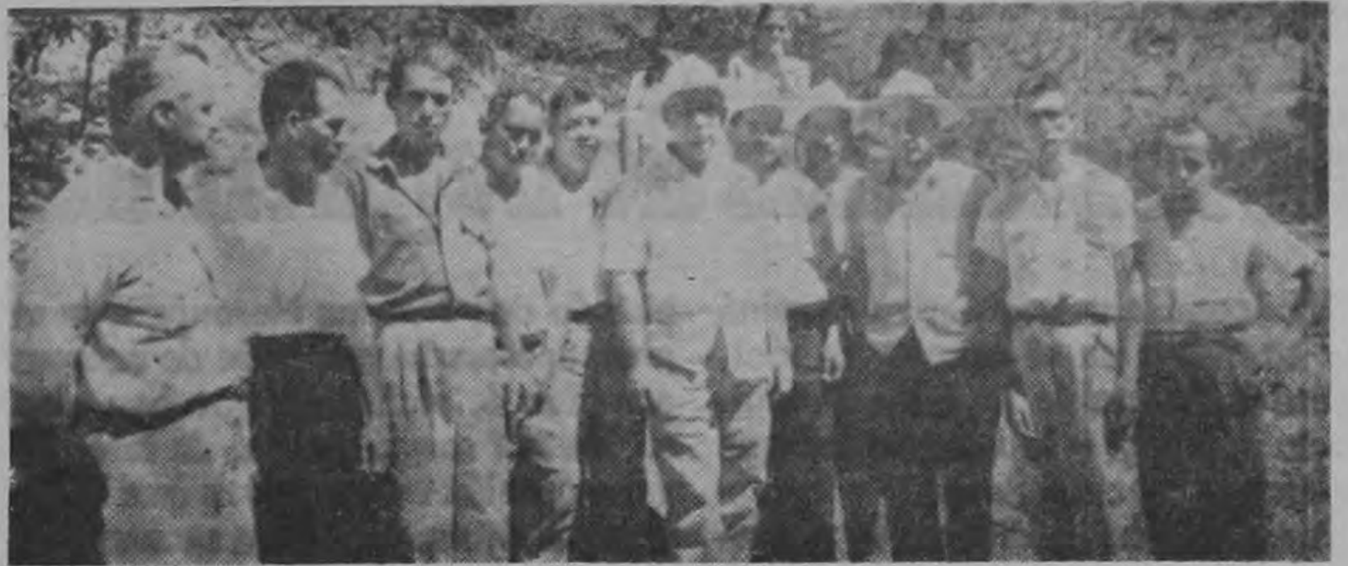
Al terminar la asamblea popular con los precaristas de San Juanillo en su gira de fin de semana, el Sr. Presidente de la República se reunió con una delegación de